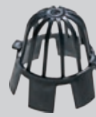
Løvfanger (hindrer løv etc. i avløpet)